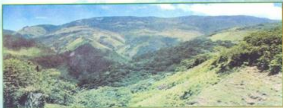
Reforestación de la Cuenca Nizaito

La cuenca del río Nizaito ha sido objeto de una fuerte intervención por parte de agricultores migratorios, los cuales atraídos por los suelos vírgenes, el clima y la facilidad de acceso, han estado desarrollando siembra intensiva del cultivo de yautía y otros. Estas labores se realizan mediante la tumba, quema, cultivo y abandono del predio de terreno. La falta de conocimientos y política forestal de los habitantes de la cuenca ha contribuido al alto grado de deforestación.