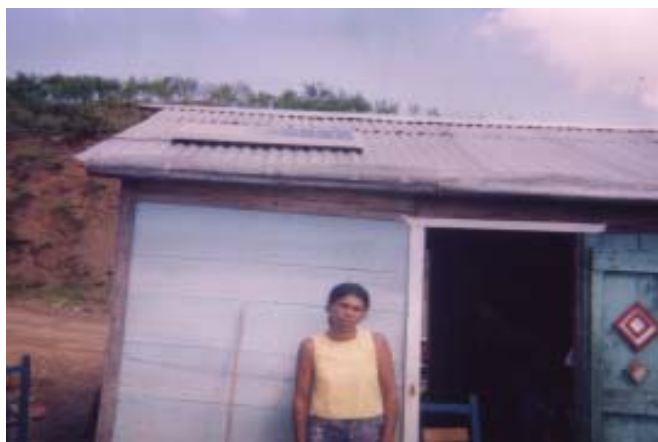
Sistema solar en la comunidad del Jengibre.

Además, se han dado cuenta de que la forma tradicional de producción de granos no es sostenible, ya que la inversión no siempre proporciona los beneficios esperados. Por eso, comenzaron, como un apoyo de los técnicos de FECADESJ, a implementar parcelas agroforestales, para la producción de frutales y cultivos: utilizando técnicas de cultivos adecuadas para zonas montañosas, no quemando los terrenos para la siembra y haciendo prácticas de conservación de suelos.