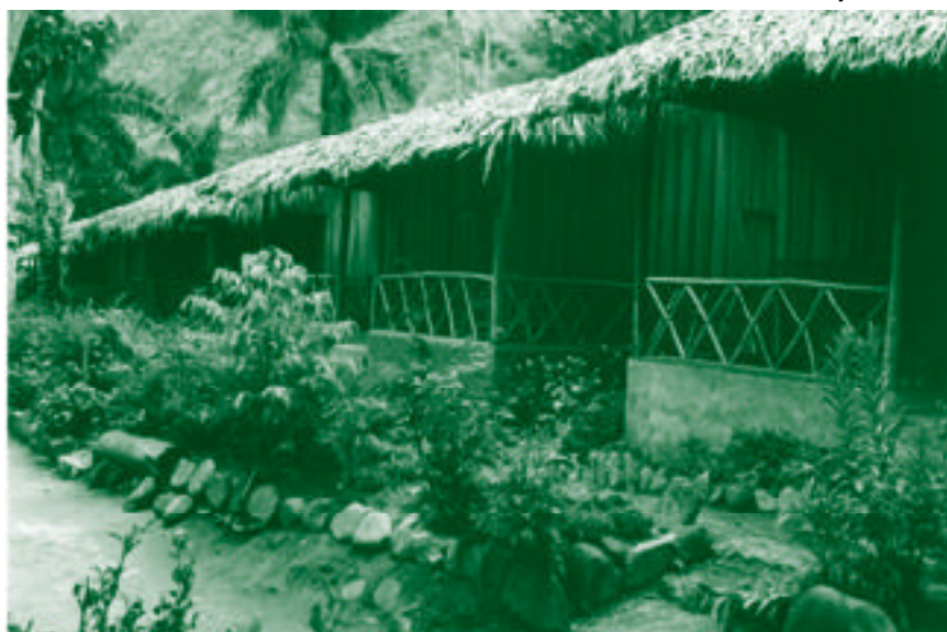
Vista general de las cabañas ecoturísticas de Los Calabazos.

formó un comité coordinador formado por 4 mujeres y 3 hombres que pertenecen a ambas organizaciones de la comunidad. Su trabajo es planificar las actividades que hay que hacer para dar mantenimiento a las infraestructuras, para la promoción, y para la gestión cotidiana del restaurante y las cabañas. El trabajo en equipo no siempre es fácil y no todos y todas participan con el mismo entusiasmo en las tareas. Sin embargo, a pesar de sus debilidades y de todo lo que tienen que mejorar ya recorrieron mucho camino y van a seguir adelante mejorando sus capacidades, formándose para dar un mejor servicio porque saben muy bien que el ecoturismo puede ser también un negocio comunitario.