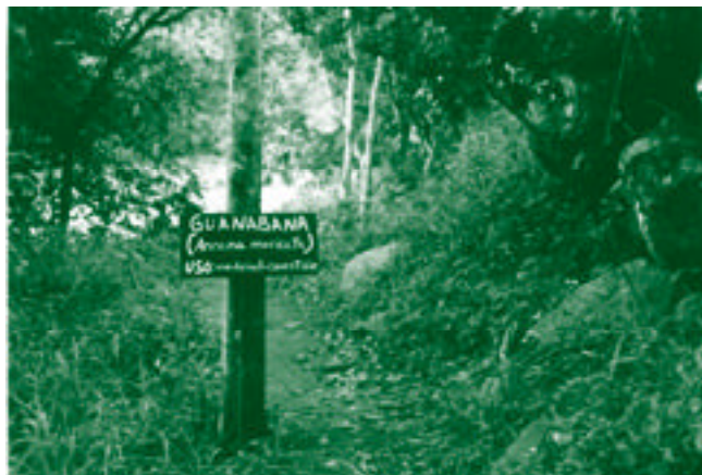
Vista de uno de los senderos que conduce al balneario.

Hombres y mujeres aunaron esfuerzos para mejorar las instalaciones y apoyados por Juntayaque, la organización sombrilla de las comunidades organizadas